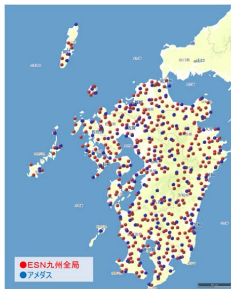
アメダス+環境センサーネットワーク(ESN)